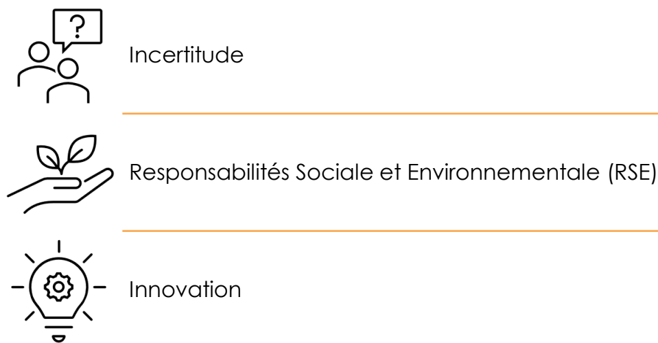
Figure 4. Les grands défis des entreprises

Les entreprises sont confrontées à de nombreux changements. La mondialisation des marchés, la concurrence toujours plus importante, les technologies en constante évolution, etc., impliquent de nouveaux comportements pour les entreprises. Elles doivent aujourd'hui relever de nouveaux défis.