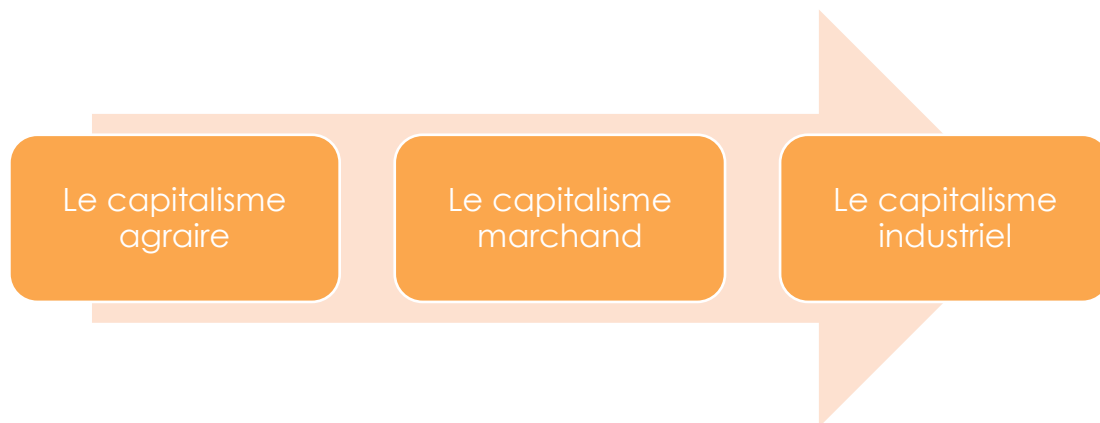
Figure 1. L'histoire de l'entreprise

Quand l'entreprise comme mode de production est-elle apparue ?