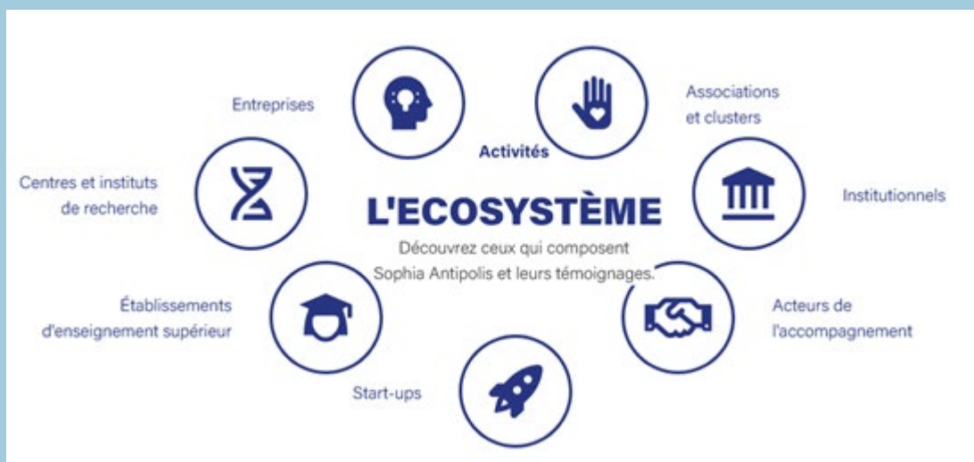
Figure 1 : l'écosystème de Sophia Antipolis

Aujourd'hui Sophia Antipolis représente un laboratoire de l'innovation où se côtoient des centres de R&D privés, des laboratoires publics et des filières de formation afin de favoriser les échanges d'idées et encourager l'innovation scientifique et technologique entre chercheurs, industriels, étudiants et enseignants.