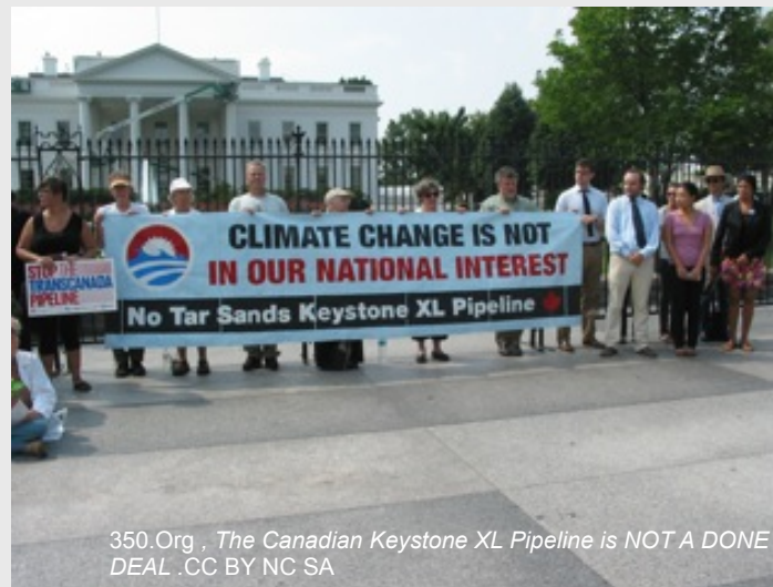
Manifestation contre la construction d'un oléoduc destiné au transport de pétrole issu de sables bitumineux, Canada