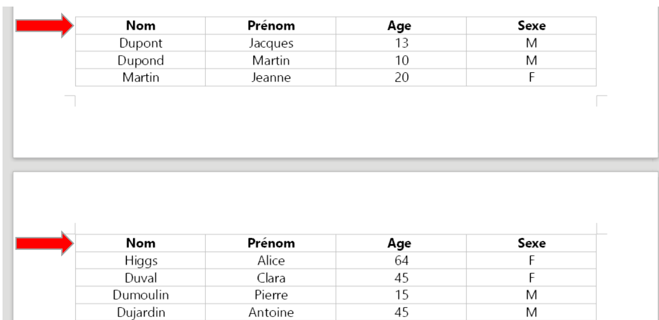
Figure 3 : Résultat de la manœuvre.

Cela aura pour effet d'ajouter automatiquement la première ligne du tableau sur la première ligne de la page suivante, l'information est conservée (Figure 3).