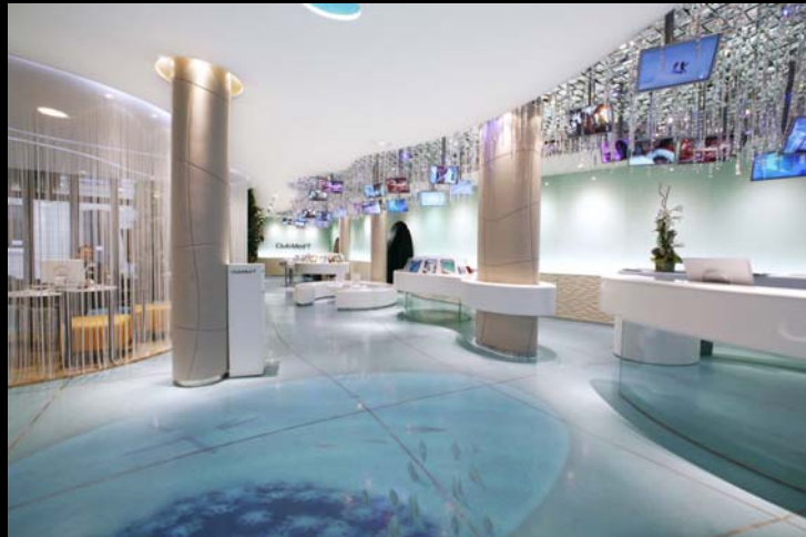
Club Med (AKDV) / Paris