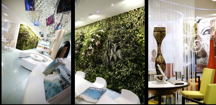
Club Med (AKDV) / Paris