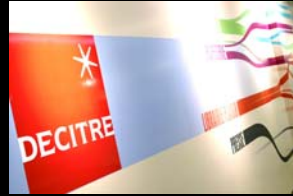
Decitre (AKDV) / Lyon