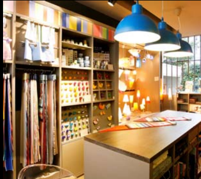
Vibel (AKDV) / Paris