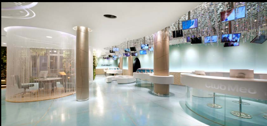
Club Med (AKDV) / Paris