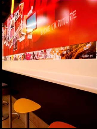
KFC (AKDV) / Paris