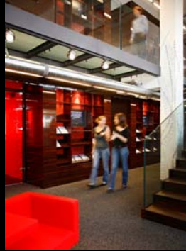
Kea & Partners (AKDV) / Paris