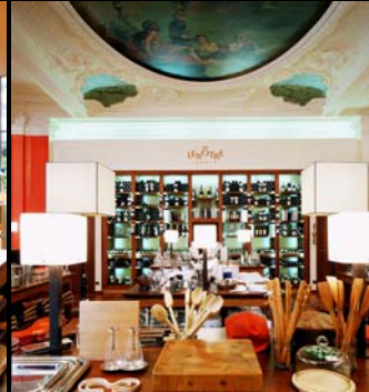
Le Nôtre (Jean-Claude Prinz) / Paris