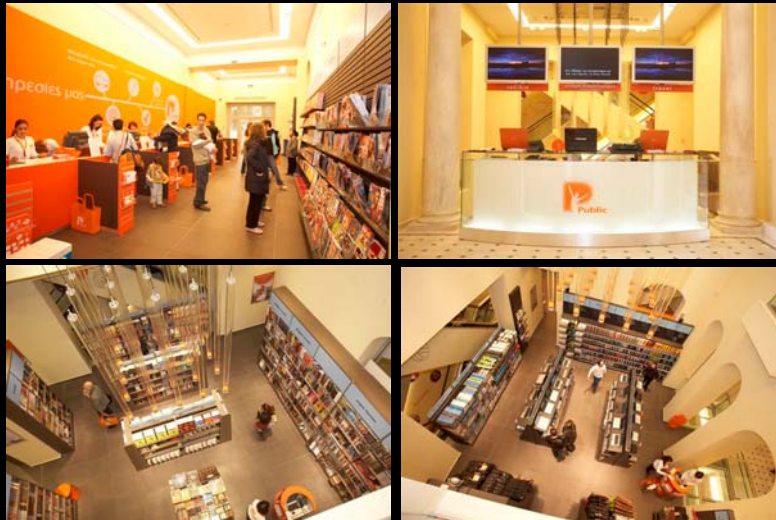
Public (AKDV) Athènes