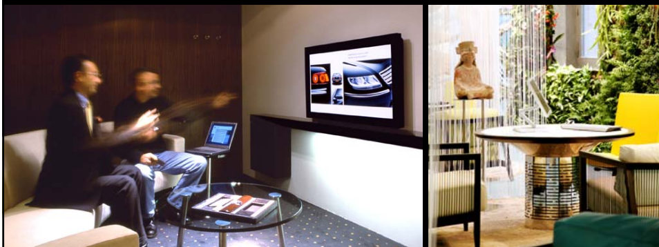
JW Espace Phaeton (AKDV) / Paris