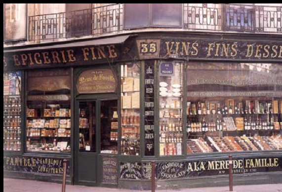
La Mère de famille / Paris