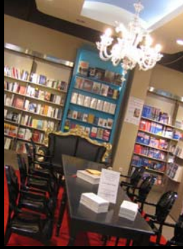
Decitre (AKDV) / Lyon