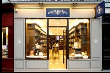
Comtesse du Barry (AKDV) / Paris