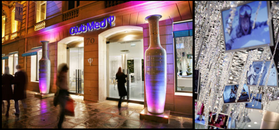
Club Med (AKDV) / Paris