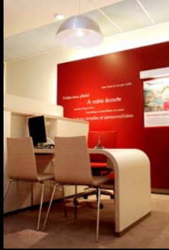
Cofinoga (AKDV) / Paris