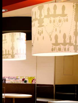
KFC (AKDV) / Paris