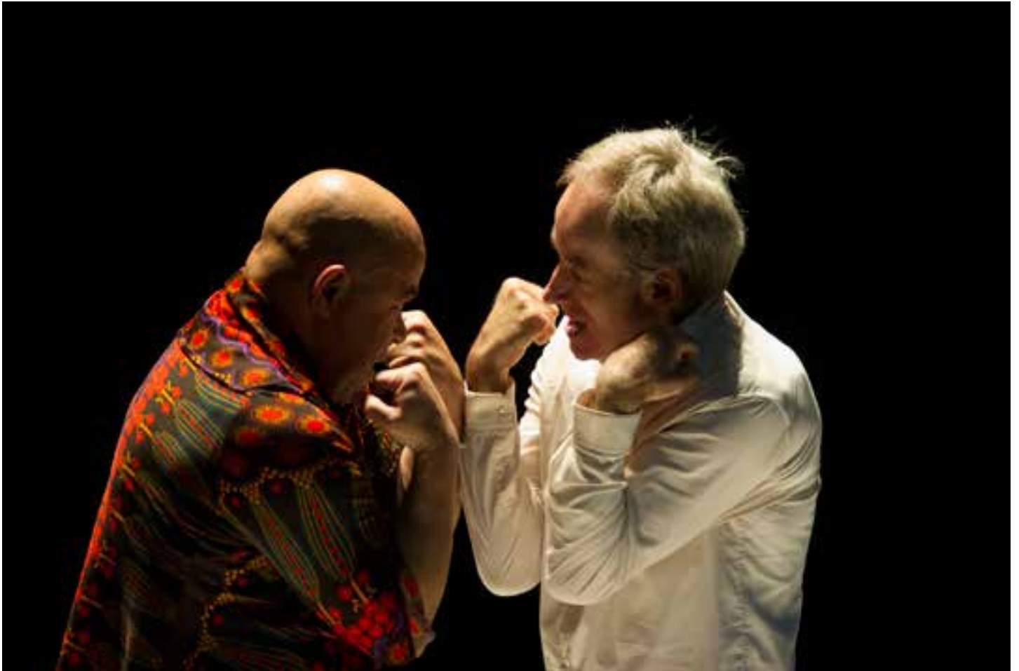
(DES)INCARNAT(S), CRÉATION OCTOBRE 2012