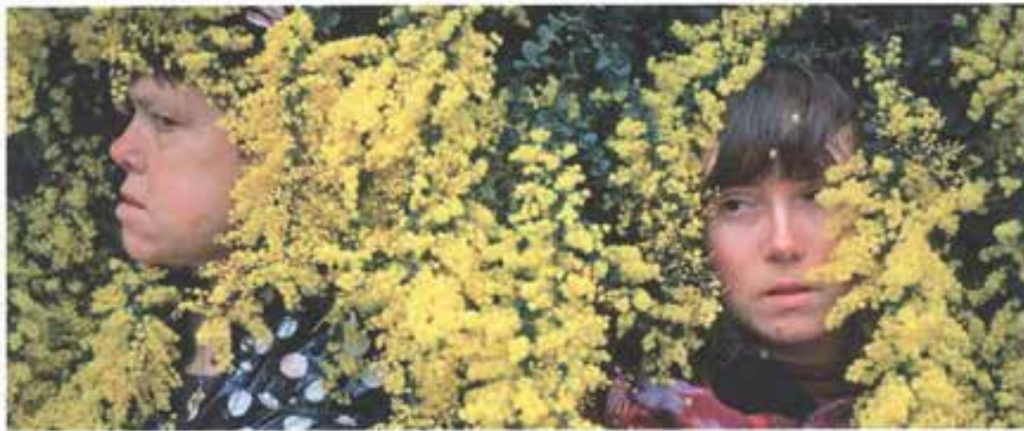
Les acteurs nus par le photographe Myriam Richard

En novembre, Madeleine Louarn présentera sa nouvelle création, « Les Oiseaux » d'Aristophane. Sur scène, des acteurs professionnels de l'Atelier Catalyse, tous handicapés mentaux.