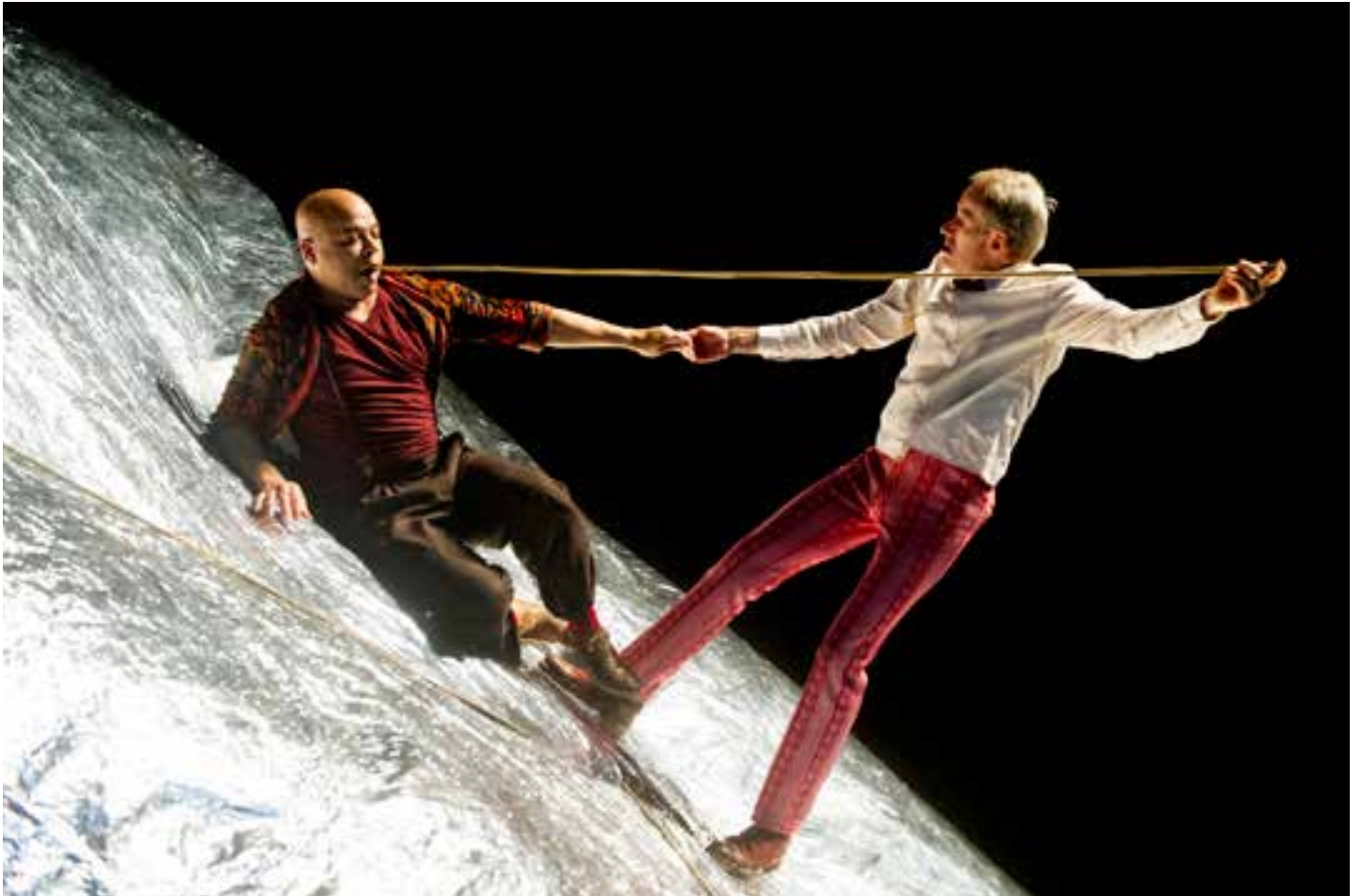
(DES)INCARNAT(S), CRÉATION OCTOBRE 2012