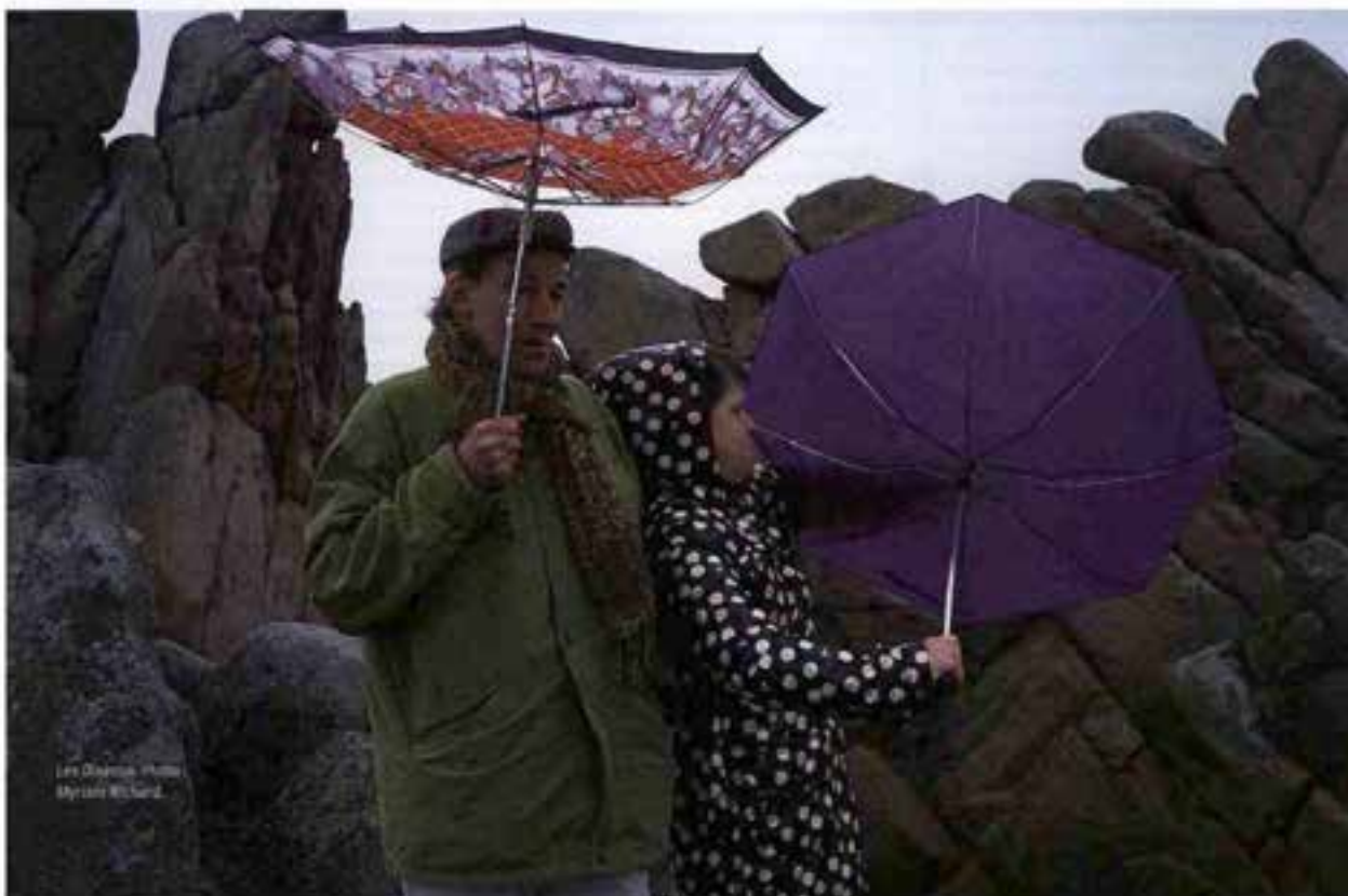
Les Oiseaux

retrouve dans tout ce qui se passe durant la répétition. Fragiles, doux et perçants. Comme des oiseaux dans le creux de la main. Leur fragilité commence avec la terrible difficulté à « apprendre par cœur » – le cœur de chauffe du travail de l'acteur, son outil de protection immédiat. Même s'ils ont traversé de grands textes du répertoire (jusqu'au Songe d'une nuit d'été de Shakespeare – un monde fabuleux et monstrueux qui leur va à merveille), les mots risquent sans cesse de rester un corps étranger, qui leur parvient de l'extérieur, « soufflé ». D'où la présence permanente d'un souffleur 3 , à vue sur le plateau. Ce moment où il rattrape un acteur en perdition est de toute beauté. D'où l'importance de la rencontre avec Bernardo Montet, qui leur a fait comprendre que leur corps était un magnifique outil d'expression, dont ils peuvent se servir pour dire autrement. Un pas en direction de l'indépendance... Et puis la musique a également servi de déclencheur. Depuis plusieurs mois, aussi étrange